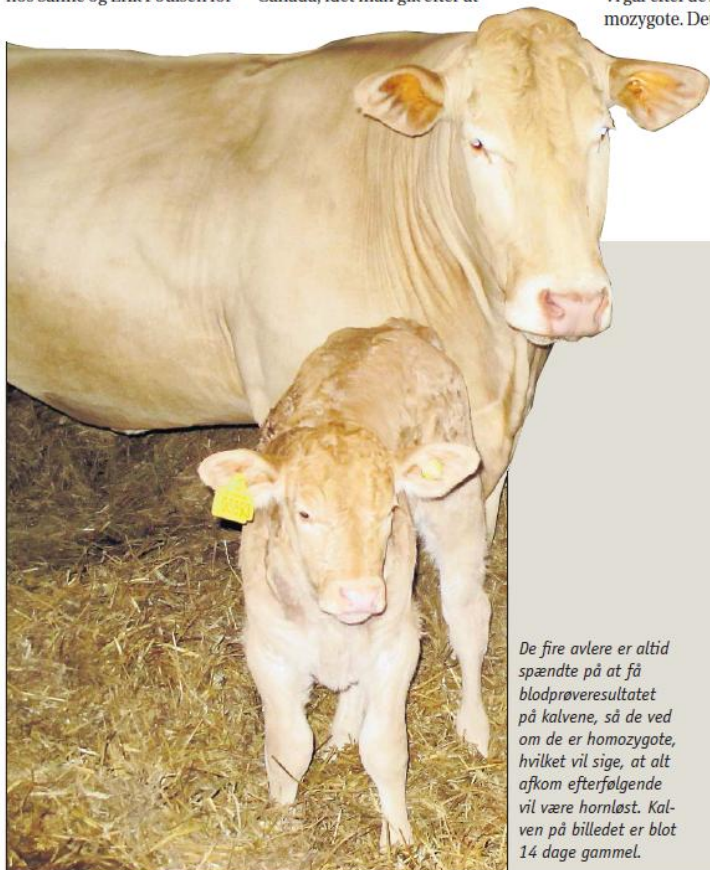
De fire avlere er altid spændte på at få blodprøveresultatet på kalvene, så de ved om de er homozygote, hvilket vil sige, at alt afkom efterfølgende vil være hornløst. Kalven på billedet er blot 14 dage gammel.

- Det er også Viking, der har klaret det praktiske i forhold til salg af sæd til Frankrig, men det opsøgende salg har vi selv stået for via gamle kontakter. Desuden er to franske dommere, der fik øje for dyrene på