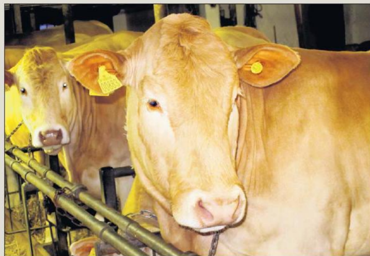
Den polled kvie nummer 883: BABS Francisca Pp, født 22.08.2010 med BABS Don Juan Pp til far og BABS Donna Pp til mor står også i stalden på Gydegaard. Den er ikke nemt at se forskel på de polled og ikke polled dyr, men det stykke mellem ørerne, hvor hornene normalt kommer, er en anelse smallere på de polled dyr.