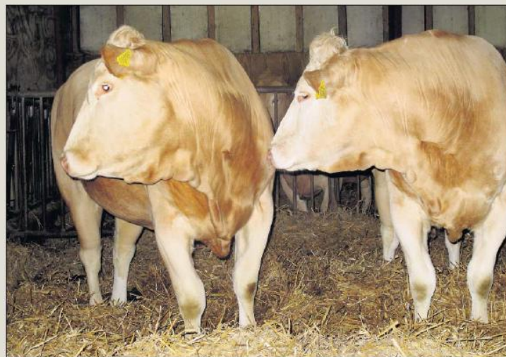
Den perfekte Blonde er høj, lang og muskuløs og elegant på samme tid og så er kødkvaliteten meget høj. Desuden ønsker man en lys farve, som både nummer 860 t.v.: GG Ella f. 24.02.2009. Far: GG Asterix, Mor: GG Ninka og nummer 863 t.h.: GG Elle f. 24.05.2009. Far: GG Asterix, Mor: GG Maude, som er helsøster til GG Ninka.