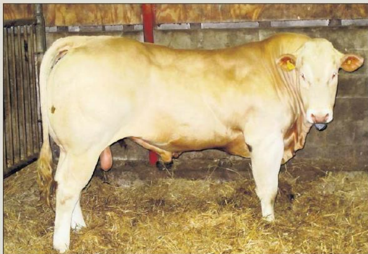
Tyren GG Figaro på billedet er født den 04.06.2010 og er efter GG Asterix F og moderen er GG Ninka, der er stammoder og grundpiller i hele det polledeprojekt.

cab@effektivtlandbrug.dk telefon 63 38 25 38